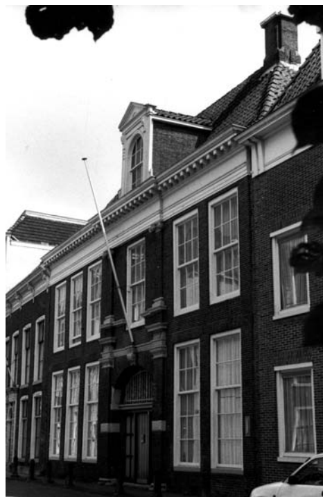
Het pand 'Prins van Waldeck' aan de Grote Kerkstraat zuidzijde nr. 18